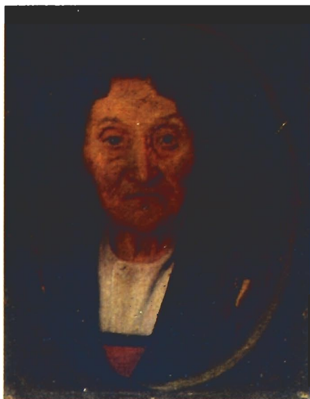
Ritratti del pittore miglierinese Agostino Guzzi