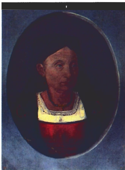
Ritratti del pittore miglierinese Agostino Guzzi