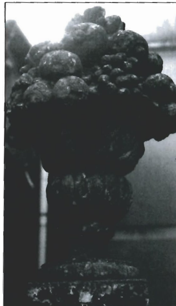
Decorazione, opera dei Babbari